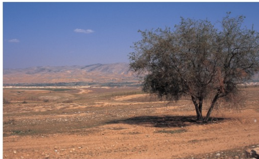
El cálido valle del río Jordán con los montes del este al fondo.

y ver lo que estaba teniendo lugar hace siglos. El estilo de vida de sus gentes ha quedado registrado también en palabras y artefactos, en imágenes e incluso en la basura del pasado. Y es por medio del estudio de estas fuentes que es posible volver a captar hasta cierto punto cómo se vivía en los tiempos bíblicos.